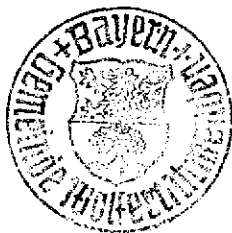
Beate Ullrich Erste Bürgermeisterin